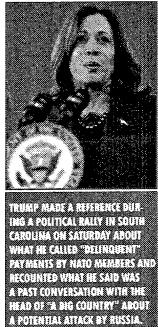
'TRUMP MADE A REFERENCE DURING A POLITICAL RALLY IN SOUTH CAROLINA ON SATURDAY ABOUT WHAT HE CALLED "DELINQUENT PAYMENTS BY NATO MEMBERS AND RECOUNTED WHAT HE SAID WAS A PAST CONVERSATION WITH THE HEAD OF "A BIG COUNTRY" ABOUT A POTENTIAL ATTACK BY RUSSIA.'